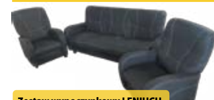
Zestaw wypoczynkowy LENIUCH