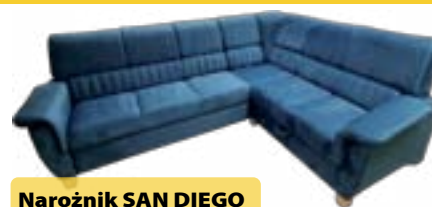
Narożnik SAN DIEGO