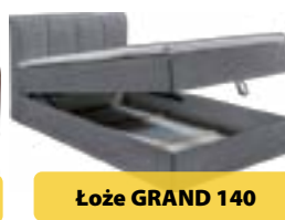
Łoże GRAND 140